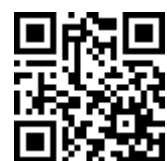
ケータイノムコム アクセスバーコード