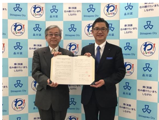
2017年3月27日 品川区役所において協定締結

地域に密着し、地元の皆様に親しまれるブランドを目指す中、日々の業務活動を通じて、地域社会に貢献できる機会と考え、3月27日（月）、品川区と品川区社会福祉協議会と当社の三者間で、「民間企業と連携した高齢者等地域見守りネットワーク事業」に関する協定を締結しました。品川区において、本協定の締結は、不動産会社では当社が初となります。